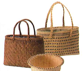
奥会津編み組細工