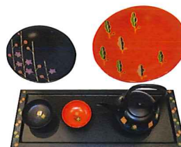
会津塗絵付け実演