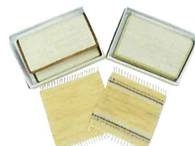
昭和村からむし織実演