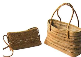
三島町編み組細工実演