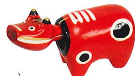
柳津町赤べこ張り子実演

事前予約、内容等のお問い合わせは、会津若松市役所商工課(0242-39-1252)まで