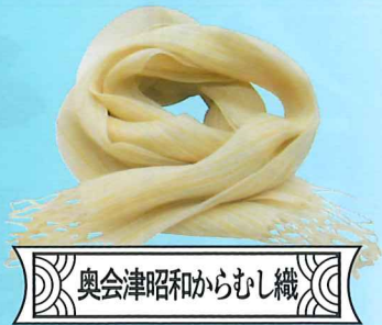
奥会津昭和からむし織